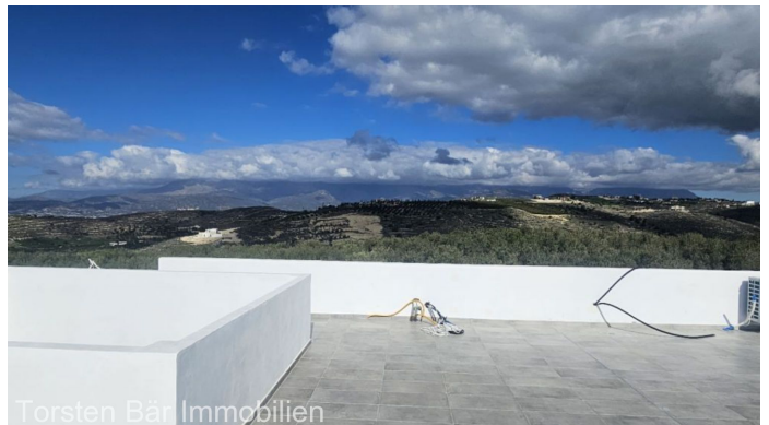
Torsten Bär Immobilien