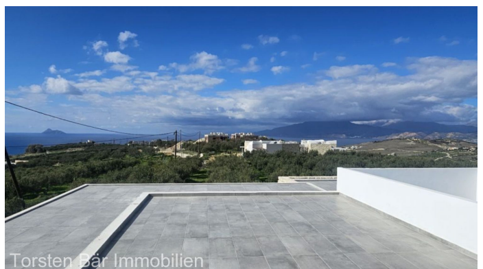
Torsten Bär Immobilien