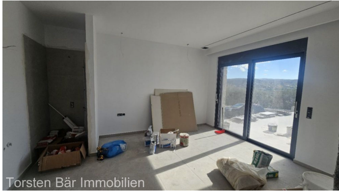
Torsten Bär Immobilien