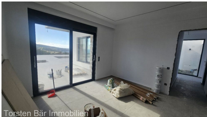
Torsten Bär Immobilien