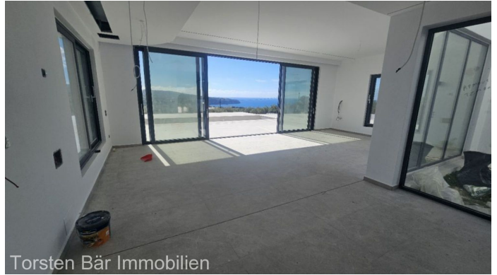
Torsten Bär Immobilien