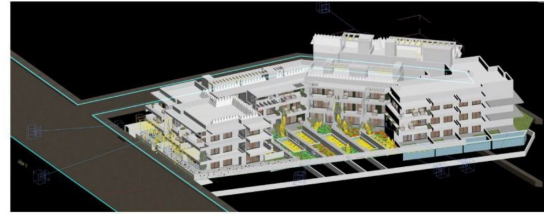
Photorealistic Rendering -Picture 1 -